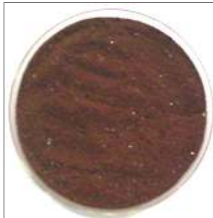
प्राकृतिक रंग का पाउडर