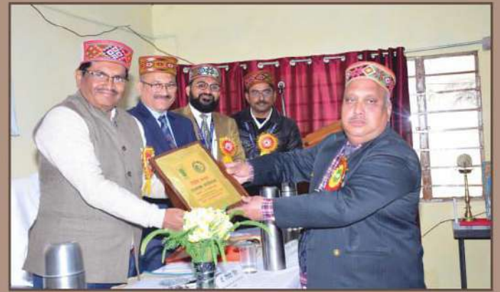
उत्तरी शीतोष्ण क्षेत्रीय केन्द्र, गड़सा में राजभाषा कार्यशाला का आयोजन