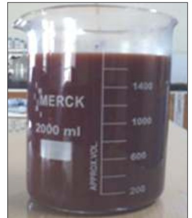
पानी द्वारा रंग का निष्कर्षण