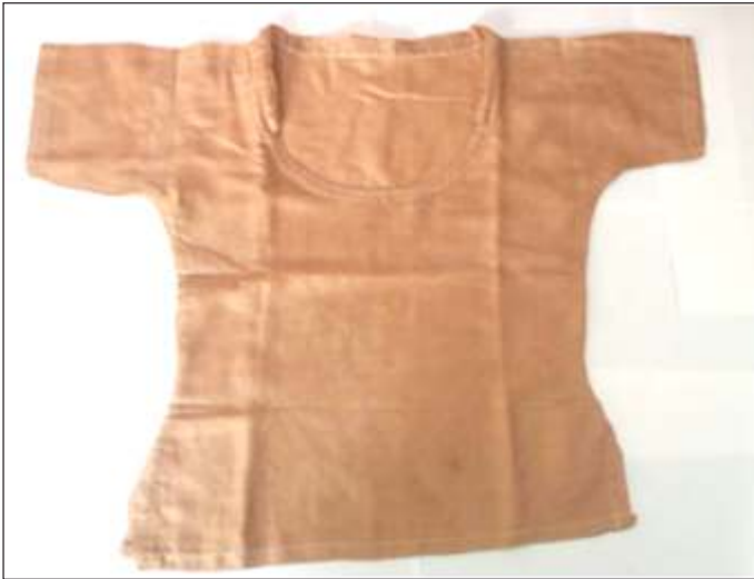
प्राकृतिक रंग से रंगा हुआ वस्त्र

वस्त्र निर्माण एवं वस्त्र रसायन विभाग द्वारा विगत दशक के दौरान ऊनी कपड़े को प्राकृतिक रंग से रंगाई के क्षेत्र में महत्वपूर्ण कार्य किया है। इस क्षेत्र में प्राकृतिक रंगों के विभिन्न स्रोतों जैसे – मडार, सफेदा, मूंगफली की बारीक सतह, अनार का छिलका, प्याज का छिलका, अखरोट की बाहरी सतह आदि से रंगों का निष्कर्षण के उपरान्त ऊनी कपड़े पर विभिन्न तरह के रंगों के अन्य गुणों की पहचान की गयी। इसमें कीड़ा अवरोधी, पराबैंगनी तरंग विरोधी व सूक्ष्म जीव निवारक गुणों का अध्ययन कर पता चला है कि प्राकृतिक स्रोतों से प्राप्त रंगों में उपरोक्त गुण भी पाये जाते हैं। उपरोक्त रंगों से सूती, ऊनी व रेशमी कपड़े में पक्के रंगों को प्राप्त किया जा सकता है। अनार के छिलके, केसर के फूल तथा प्याज के छिलकों से निष्कर्षण से प्राप्त रंगों को पश्मीना कपड़े पर भी खूबसूरत रंगों को प्राप्त किया गया। यह रंग पश्मीना पर पक्का रंग प्रदान करने में सफल रहे।