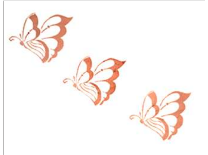
प्राकृतिक रंग से छपा हुआ वस्त्र