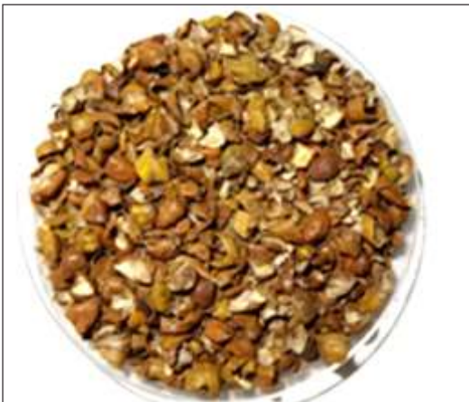
चने के छिलके-प्राकृतिक रंग का स्रोत

कुछ विशेष पौधों से प्राप्त पदार्थों द्वारा रंग निकालने के लिये कार्बनिक विलेयक उपयोग में लाते हैं। इनमें एथेनॉल प्रमुख है। क्योंकि इन पदार्थों से पानी द्वारा रंग निकलना कठिन होता है तथा रंग वाले पदार्थ पानी में विलेय नहीं होते हैं। इस विधि में प्राकृतिक रंग प्राप्त होने वाले पदार्थ को एथेनॉल में घोलते हैं। यह विधि पानी में रंग निकालने की विधि से अधिक उत्पादकता देती है, लेकिन विलायक मंहगा होने के कारण व्यावहारिक दृष्टिकोण से मंहगी पड़ती है। इस विधि में पदार्थ के पाउडर को कार्बनिक विलायक में डालकर हल्के तापमान पर उबालते हैं। उबालते समय बर्तन ढका होना चाहिए। लाख व रतन जोति रंजक विलायक विधि द्वारा निष्कर्षण किया जाता है।