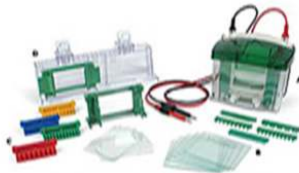
चित्र :- 1 पॉलीऐक्रिलामाइड जैल- इलेक्ट्रोफोरेसिस उपकरण

पीसीआर-एसएससीपी आण्विक चिन्हक के उपयोग से डीएनए के किसी भी भाग पर उपस्थित अनेकों उत्परिवर्तन (म्यूटेशन) को बिना पीसीआर उत्पादों को प्रतिबंध एन्जाइम (Restriction enzyme) से पाचन से किया जा सकता है। इस चिन्हक के उपयोग से किसी भी जीन की आनुवंशिक बहुरूपता के लिए हर पीसीआर उत्पाद को सिक्वेसिंग करवाने की आवश्यकता नहीं हैं। इससे कम से कम नमूनों की सिक्वेसिंग से ही पूरी पशुधन की प्रजाति की आबादी को जीन प्रारूप में बॉटा जा सकता हैं। इसे पशुधन के अध्ययन के लिए कम से कम लागत में प्रयोग किया जा सकता है। इस आण्विक चिन्हक के प्रयोग से विश्व की अनेक प्रयोगशालाओं में पशुधन के आर्थिक महत्व के गुणों का जीन की आनुवंशिक बहुरूपता के साथ संबंध स्थापित किया जा रहा है। आजकल यह आण्विक चिन्हक बैक्टीरिया, वायरस, पादपों तथा पशुओं के विभिन्न जीनोम के जीनों में उपस्थित उत्परिवर्तन का पता करने की महत्वपूर्ण विधि है।