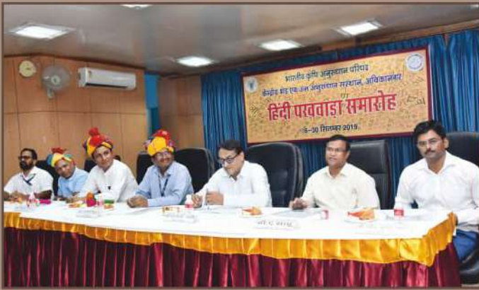
हिंदी पखवाड़ा उद्घाटन समारोह 2019