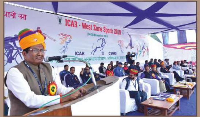
भाकअनुप - पश्चिम क्षेत्रीय खेलकूद आयोजन 2019