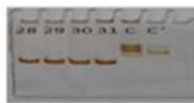
चित्र :- 2 पीसीआर- एसएससीपी आण्विक चिन्हक से विकसित बैंडिंग पैटर्न 11% पॉलीऐक्रिलामाइड जैल पर रजत अभिरंजन के विकसित बॉटा करसिन जीन के एकल- 7 ( 29 से 31 ) के शब्द का बैंडिंग पैटर्न से एक घनात्मक कंट्रोल नमूने का बैंडिंग पैटर्न है।