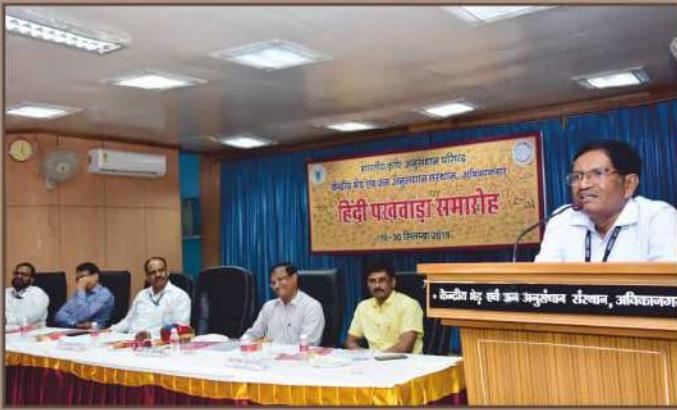
हिंदी पखवाड़ा उद्घाटन समारोह 2019