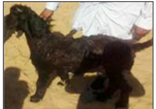
चित्र:-1 सिराही, जखराना एवं मारवड़ी नस्ल की बकरी